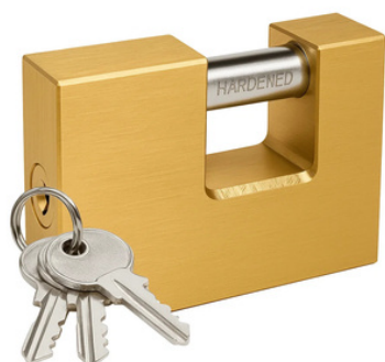
3 Chiavi duplicabili