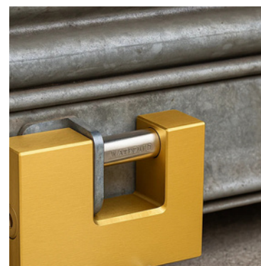
Ideale per serrande